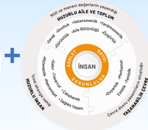
ERDEM DEĞER EYLEM MODELİ